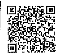
QR-Code เว็บไซต์ QR-Code เพื่อสอบถามข้อมูล