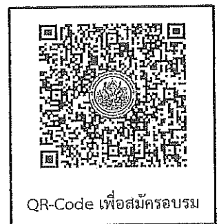
QR-Code เพื่อสมัครอบรม

ติดต่อที่ศูนย์บริการ หมายเลข ๐๙ ๕๒๒๒ ๕๒๑๘ โดยระบุชื่อ-นามสกุล หน่วยงาน และหลักสูตรที่เข้ารับการฝึกอบรมให้ชัดเจน**